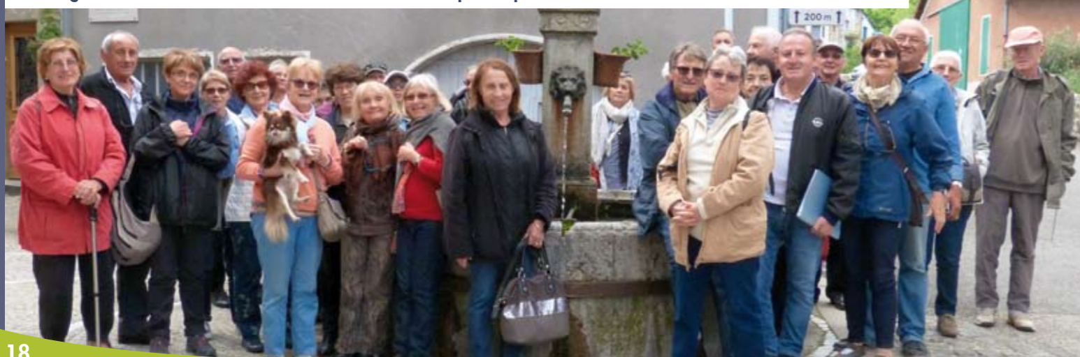
Visite guidée en mai 2017 avec l'association « la Nesque Propre » de Pernes-les-Fontaines dans le Vaucluse

Pour 2018, plusieurs projets sont en cours de réflexion, et ce afin de développer au mieux, avec nos moyens, l'image de la commune et la valorisation de son patrimoine.